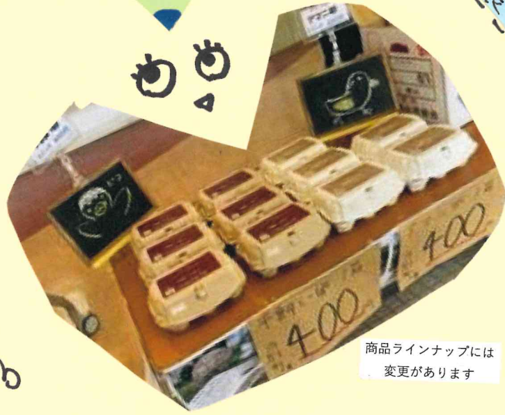
商品ラインナップには 変更があります