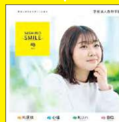
総合パンフレット