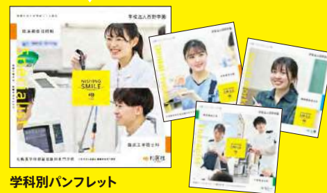
学科別パンフレット